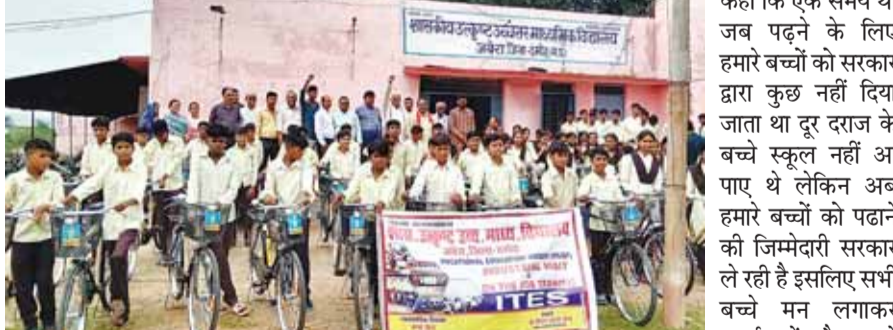
▶▶ जबेरा