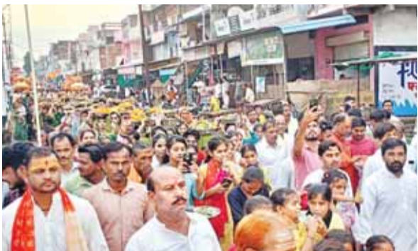
हरिभूमि न्यूज ▶▶ तेंदूखेड़ा

सावन में तेन्दूखेड़ा नगर में हर तरफ शिव भक्ति की गंगा बह रही है सावन के दूसरे सोमवार को तेन्दूखेड़ा नगर में बाबा महाकाल की नगरी उज्जैन की झलक नजर आई है तो वहीं घरों और मंदिरों में मिट्टी के पार्थिव शिवलिंग बनाकर विधि-विधान से पूजन किया गया। शाम को गौरया नदी में विसर्जित किए गए